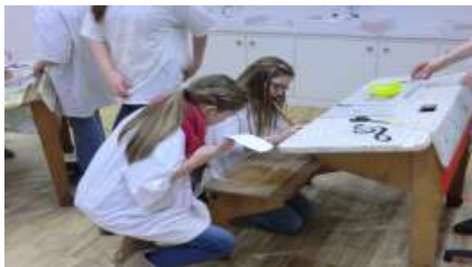
Verschönerung der Möbel

Zu den Materialien für die modernen Möbel gehören Kleister, Kleber, Pinsel, Farben, Bücher, Comics, Schwämme und Schnüre.