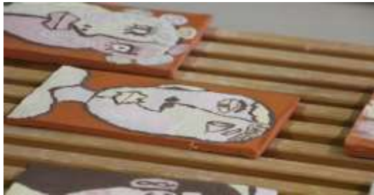
Ein paar Kacheln sind sogar schon fertig

Er war ein bekannter Maler, Bildhauer und Grafiker. Berühmt geworden ist er durch seinen Malstil - Landschaften, Menschen und Häuser wurden bei ihm kantig dargestellt - viele gerade Linien und maskenhafte Gesichter. Diesen Künstler wollen die 12 Schülerinnen und Schüler am 05. und 06. Feb. 2015 kennenlernen. Aber er soll nicht nur kennengelernt werden,