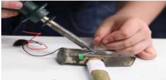
Zusammenlöten von Led und Kabel