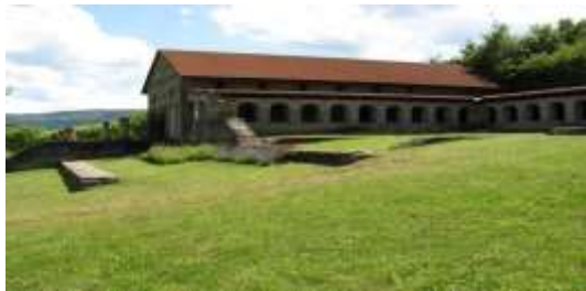
Römische Villa in Longuich