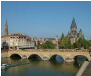
Le Moyon-Pont À Metz

Außerdem finden es viele interessant, die Stadt auf eigene Faust zu erkunden und die Vielfalt der